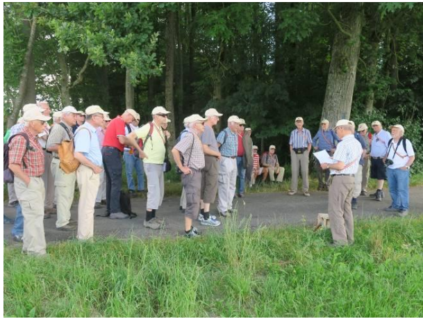
Engagierter Chico zu Natur- & Vogelschutz im Boniswiler Ried