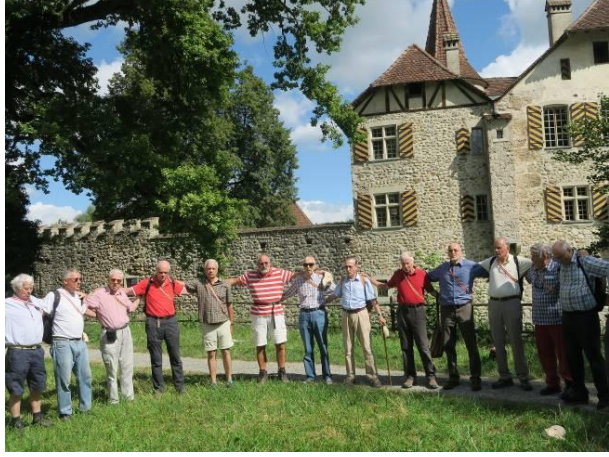
Ein würdiger Ort für die Blanche in Wander-Rekordbesetzung