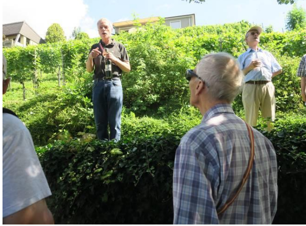
Angeheirateter Dauergast Phantom und Gattin offerieren Wein