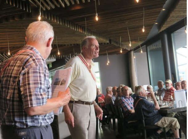
Weitere Infos von Daggi & content in der Schiffflände Birrwil

Chico für Ares, BakSchisch, Basis, Beton, brrrrmm, content, Cupido, Daggi, Dunhill, Fisch, Formfit, Fox, Frodit, Gox, Hac, Hering, Kajo, La Douce, Lotos, Marmotte, Moses, Mus, Nägger, Nero, Patt, Phantom, Pi, Psalter, Salto, Schlarp, Schtorze, Schüfeli, Schweif, Sitz-Wach!, Soda, Stockys, Storch, Sultan, Vidange, Vif, Wüitwinkel, Zack und Pfuus