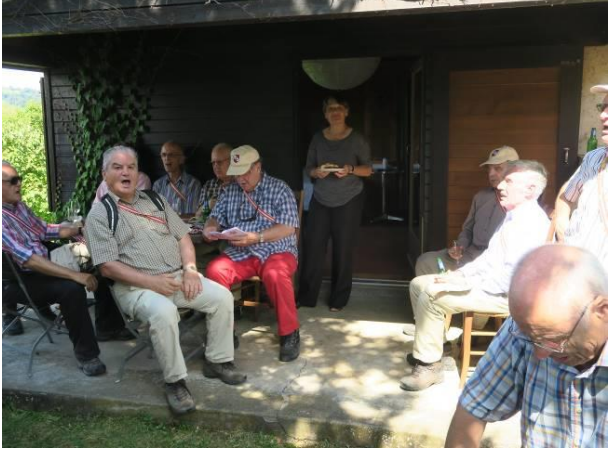
Dank für die Gastgeber mit „In jedem vollen Glase Wein“