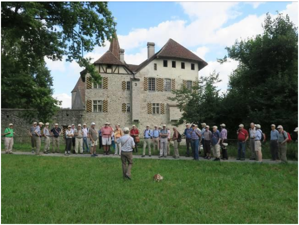
Und seine Bemerkungen zur Geschichte vom Schloss Hallwil