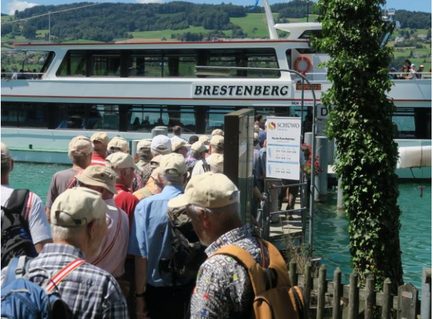
Den nächsten Apéro nimmt man geruhsam im Schiff zu sich